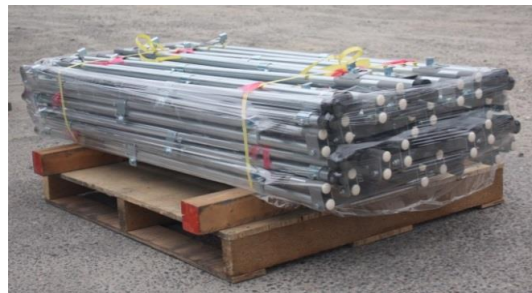
パレットの上にこのように積んで保管できます。写真は20台積み。

◎ スタンドの設置・分電盤の取付に関しては お客様の責任において確実な設置を お願い致します。