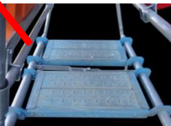
板布枠取付可能 (お客様にてご用意下さい)