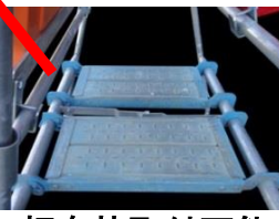
板布枠取付可能 (お客様にてご用意下さい)