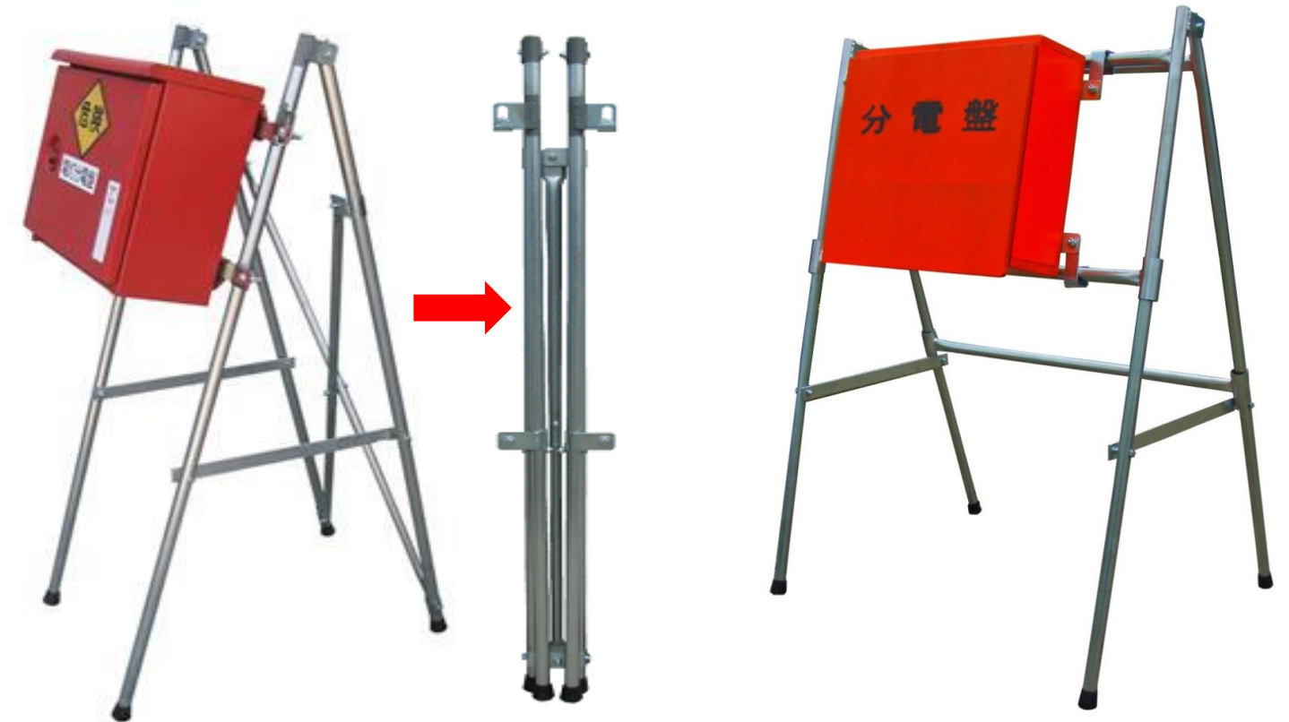
ボックスフリースタンド S型