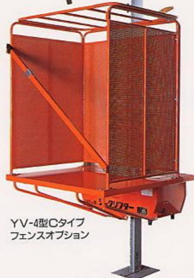
YV-4型Cタイプ フェンスオプション