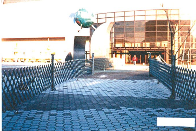
ミニドアLM 6.0mを6台連結