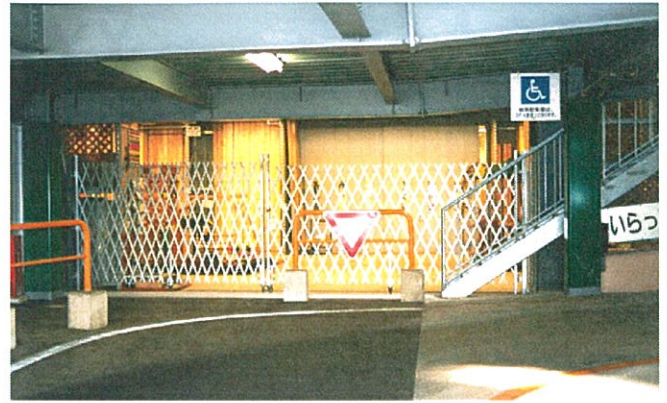
ロングドアLL 4.0m×2 (両開き仕様・本設柱に取付)