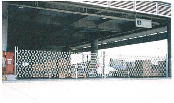
ロングドアLL 7.0m×2 (両開き仕様・本設柱に取付)