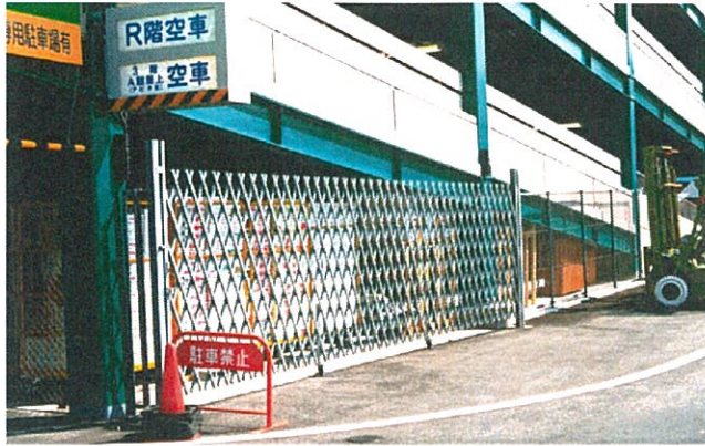
ロングドアLL 8.0m (片開き仕様・本設柱に取付)