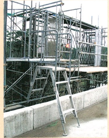
ベランダタラップ J型 設置例