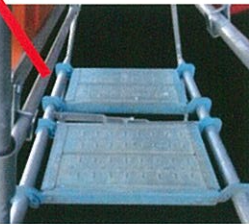
板布枠取付可能 (お客様にてご用意下さい)